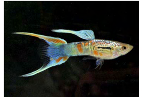
Der typische Wiener Smaragd-Doppelschwert Guppy

Haben Sie Fragen zur Guppyzucht. Die Mitglieder der Österreichischen Guppygesellschaft beraten Sie gerne! Mail: info@oegg.net